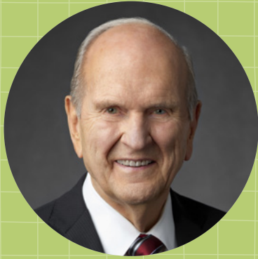
Par Russell M. Nelson, président de l'Église