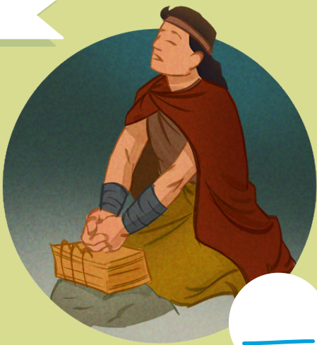
6. 摩罗乃（教义和圣约128：20；约瑟·斯密——历史1：30-34）