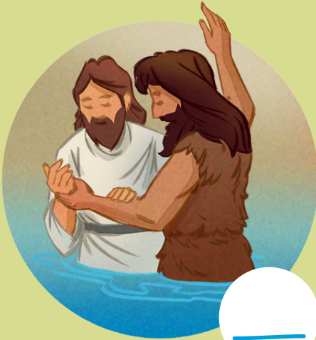
7. 施洗约翰（教义和圣约第13篇）