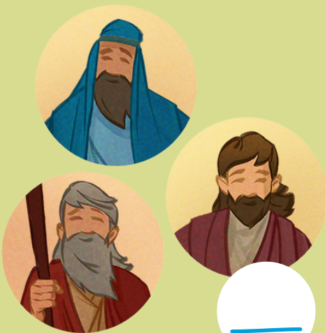
8. 摩西、以利亚和以来加（教义和圣约110：11-16）