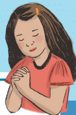
ILLUSTRATION KATY DOCKRILL

Notre Père céleste entend aussi tes prières ! Il répond habituellement par l'intermédiaire du Saint-Esprit. Choisis une histoire sur la prière (voir page 12, 36 ou 46) et lisez-la ensemble. Dans cette histoire, comment notre Père céleste a-t-il répondu à la prière ? Comment t'a-t-il répondu ?